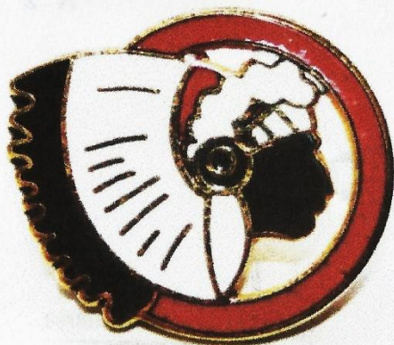
Sioux cercle rouge de la 11e escadrille