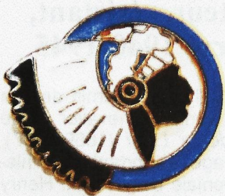
Sioux cercle bleu de la 9e escadrille

Avec la 9 e escadrille, elle aussi basée à Bierset et également équipée de R-31, la 11 e escadrille sera engagée dans la Campagne des dix-huit jours en mai 1940.